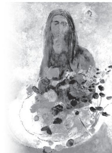
Odilon Redon: 'Myster', ca. 1880

"Digteren" rummer paradokser og psykologiske konflikter til overflod. Her er smukke og intense landskabsbeskri-