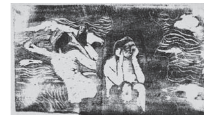
Paul Gauguin: "At the black rocks", 1899

Disse forhold vil blive nærmere undersøgt i dette foredrag.