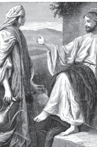
Kvinden ved Brønden, Johs. 4, 10-14