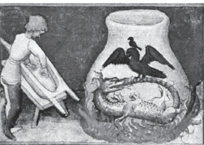
Quarobors kopert i en gryde, Aurora Consurgens, 15. årh.

Hovedvægten lægges på alkymien i middelalderen og renæssancen, men vi kommer også ind på alkymiens oprindelse i oldtiden. Til sidst ser vi på alkymistiske spor i Grimms eventyr Snehvide, Askepot og Murreldyr.