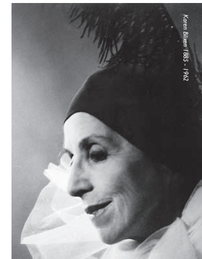
Karen Blixen 1885 - 1962