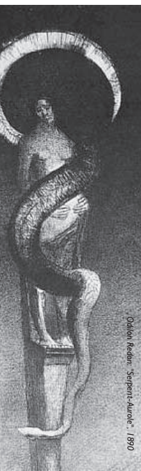
Odilon Redon: 'Serpent-Auole', 1890